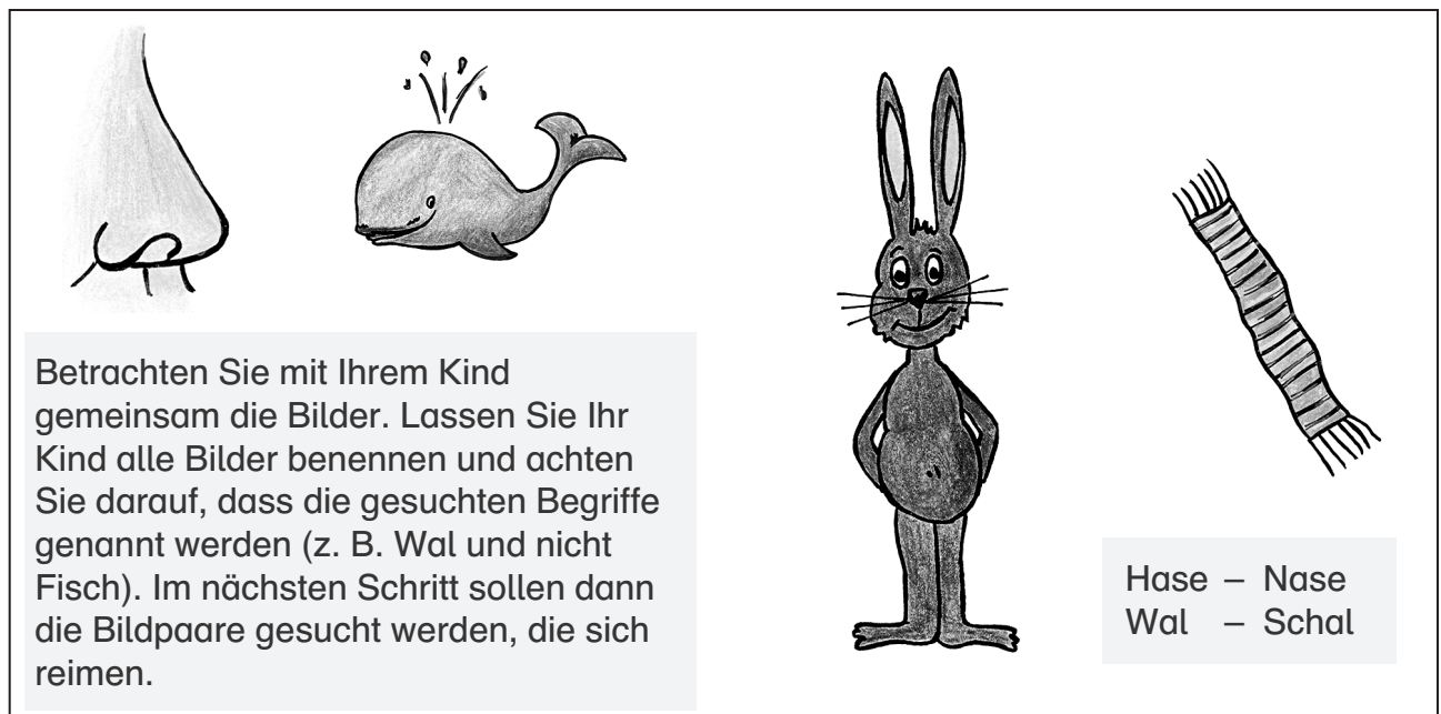
Abb. 3: Aktivität „Reimen mit Bildern“

Im Alltag kommt es meist auf den Inhalt der Sprache an. Auch Kinder konzentrieren sich zunächst darauf. Um auf das Lesen- und Schreibenlernen vorbereitet zu sein, müssen sie